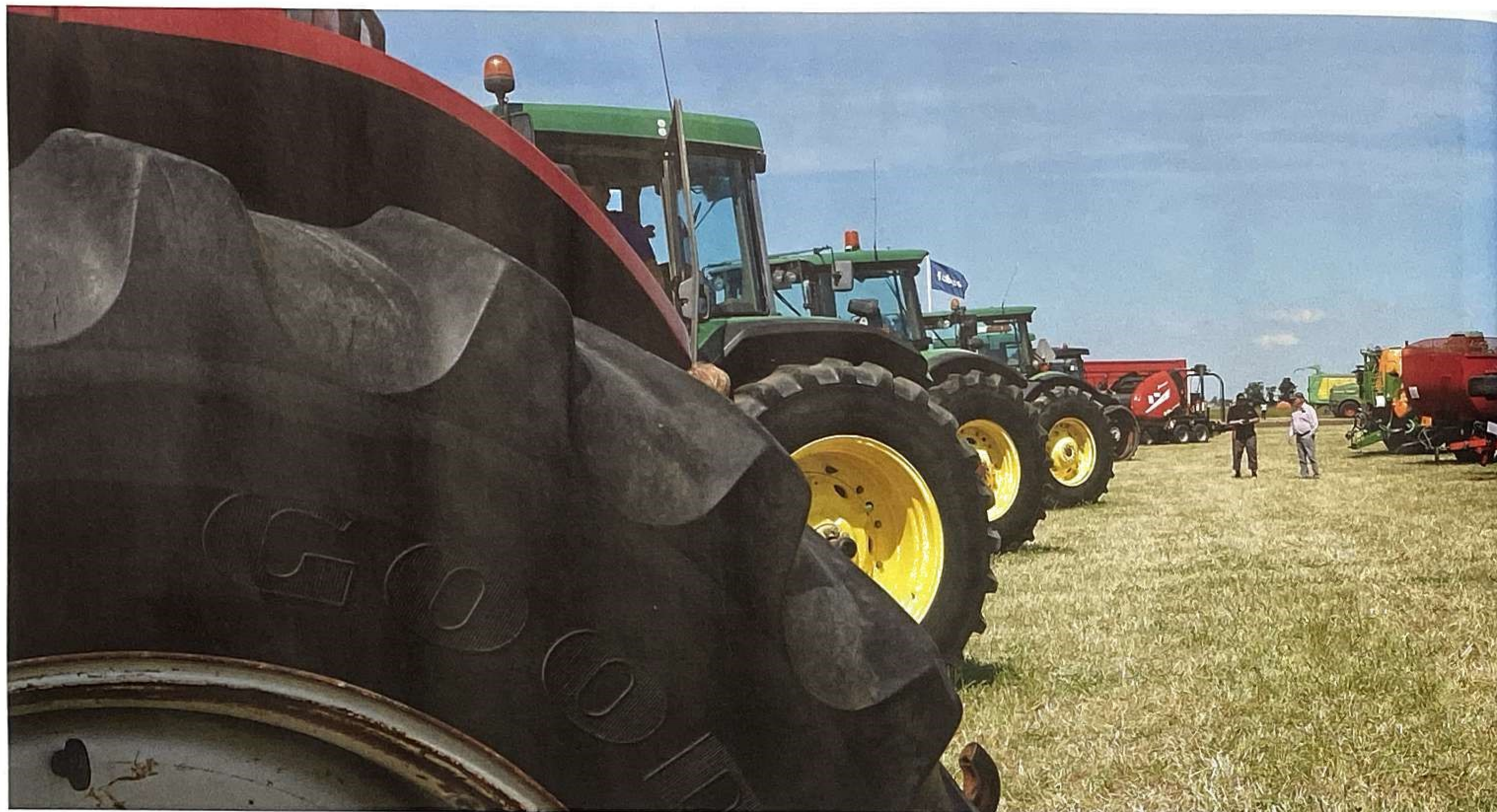
Med regelbundet underhåll ska maskinparken behålla sitt värde.