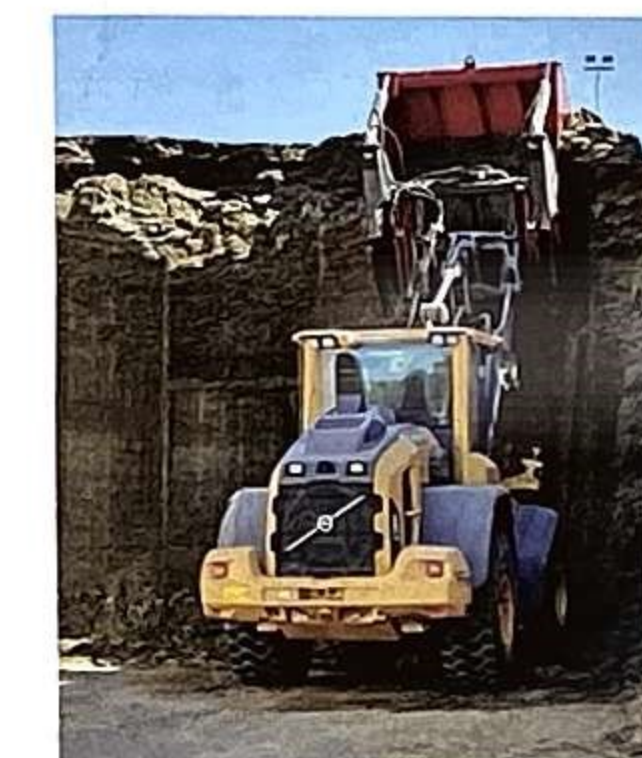
Vadsbo Mjölks lastmaskin är reggad i appen från Farmers First.

Medarbetaren som får uppdraget tar upp en lista i telefonen på vad som ska göras vid detta servicetillfälle, utför åtgärderna och bockar av efter hand. Gäller det en maskin som går dygnet runt i stallarna och ska servas en gång i veckan så läggs det in på en veckodag och